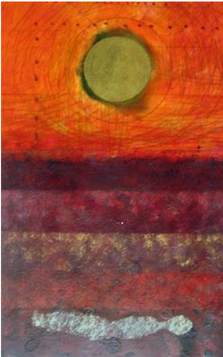
Jeltje Hoogenkamp: Grond , 2012, 50 x 70 cm, potlood, pen, Oost-Indische inkt en acrylverf.

Deze verzuchting richt zich tot God. Onze vragen stijgen op naar de hemel. Een verzuchting gaat nog dieper dan een gebed. Het is het Kyrië-eleison in onze kerkdienst. Een verzuchting roep je uit als je niet meer weet wat te bidden. Als je niet meer weet hoe het verder moet. Mijn God, mijn god, waarom hebt u mij verlaten?